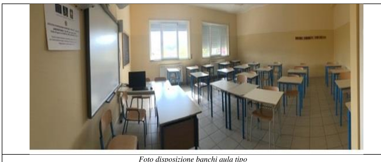
Foto disposizione banchi aula tipo

Ciascun alunno è a distanza superiore di 100 cm dai compagni sia lateralmente che avanti e dietro.