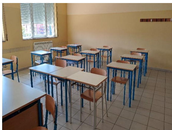
Foto disposizione banchi aula tipo